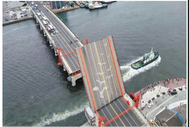
안전사고 대비 시설물 확인(영도대교)