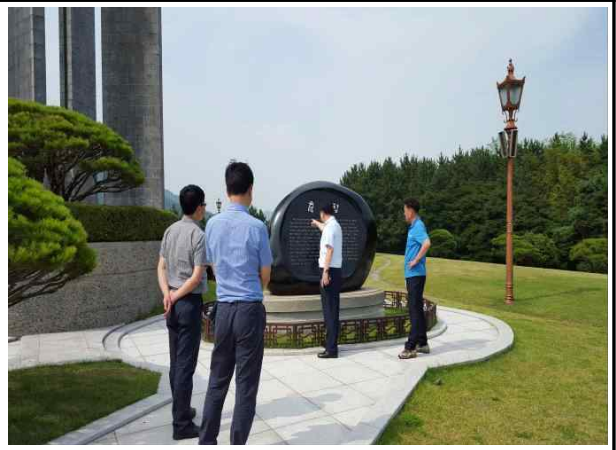
시설물 유지관리상태 점검(중앙공원)