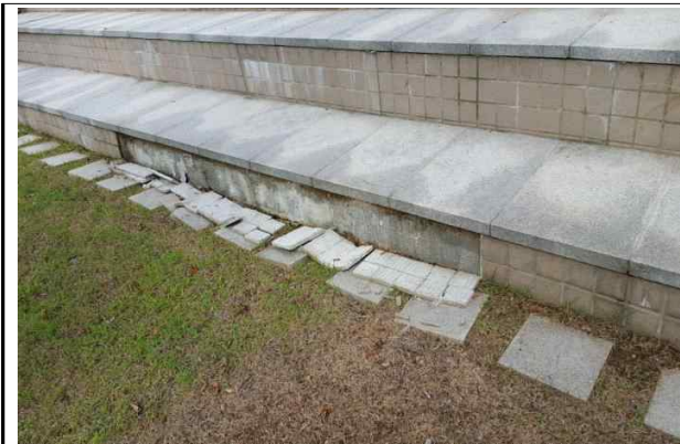
주차장 계단부 타일탈락(추모공원)