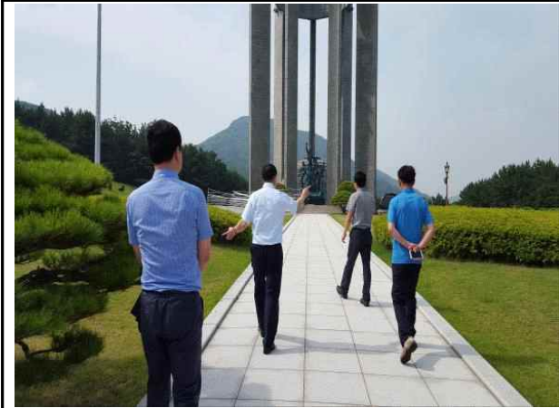
시설물 현장확인(감사실장 외 3명)