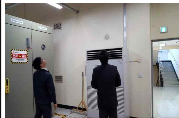
시설물 누수 등 재난재해 대비 점검